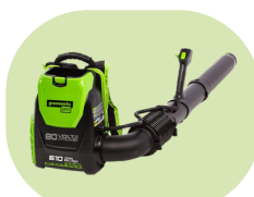
Sopladores de mochila